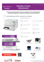
BMG Labtech www.bgnt.pl/gazeta4