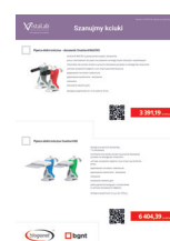
VistaLab i DragonLab www.bgnt.pl/gazeta9